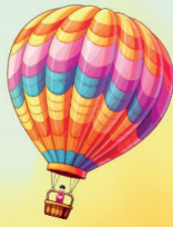
Tableau de Famille