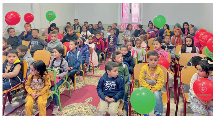
Une délégation de Thorey-Lyautey en déplacement à Ait Sedrate ;