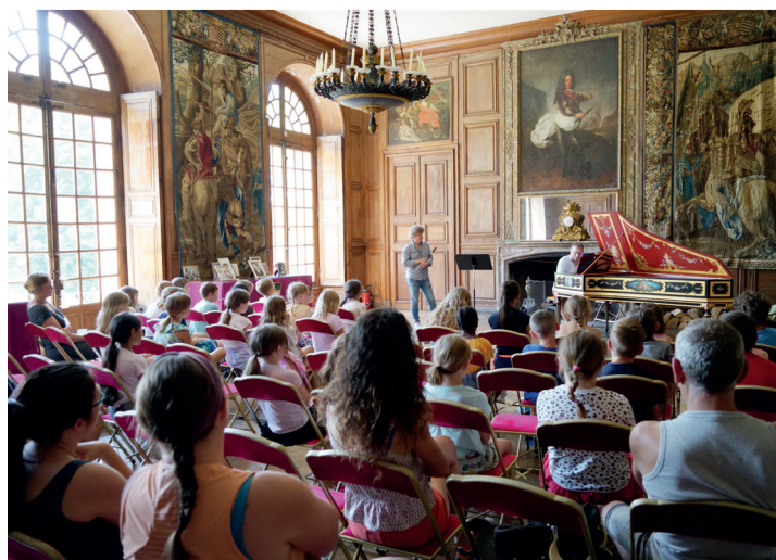
Représentation de l'école de musique lors d'un concert à Haroué, le 9 juin 2023

A-T : c'est un lieu où je me rends toutes les semaines pour prendre mon cours de violon. Je peux y rencontrer des personnes de tout âge. Il est vrai que chacun peut y trouver sa place par un programme à la carte de l'initiation au perfectionnement avec une équipe de professeurs qualifiés. En tant qu'adulte, mon envie est d'apprendre la musique sans pression et avec plaisir. Et il est vrai, les échanges entre les apprenants et les professeurs se font en toute convivialité.