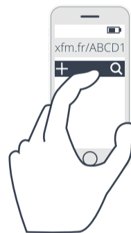
Navigateur internet lien raccourci