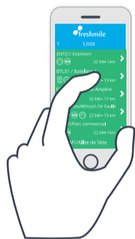
Application mobile Freshmile