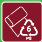
Films Plastiques, Polystyrène