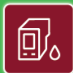
Cartouches Radiographies d'encre