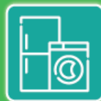
Appareils Électroniques et Électriques