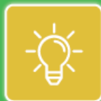
Ampoules et Néons