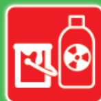
Produits * Toxiques