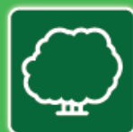
Déchets Verts * ( ligneux )