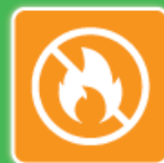
Tout-venant * Non Incinérable