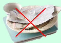
Vaisselle, faïence, porcelaine ORDURES MÉNAGÈRES