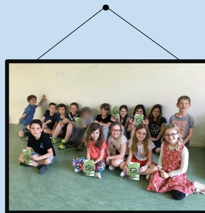
Les élèves CM1-CM2 de l'école de Xirocourt