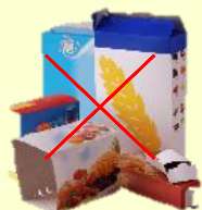
Emballages cartons CONTENEUR BLEU