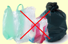
Sacs poubelles, sacs plastiques et suremballages plastiques (type packs d'eau, ...) ORDURES MÉNAGÈRES

Doivent être VIDÉS et ne doivent pas être IMBRIQUÉS