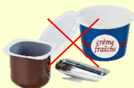
Pots de crème et de yaourt ORDURES MÉNAGÈRES