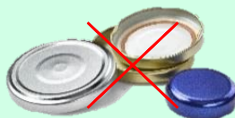
Couvercles et bouchons CONTENEUR JAUNE