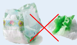
Articles d'hygiène (couches, mouchoirs, ...) ORDURES MÉNAGÈRES