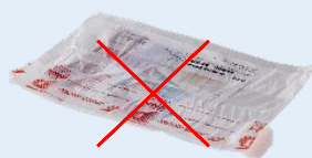
Magazines ou journaux avec suremballage plastique MAGAZINE : CONTENEUR BLEU FILM PLASTIQUE : ORDURES MÉNAGÈRES